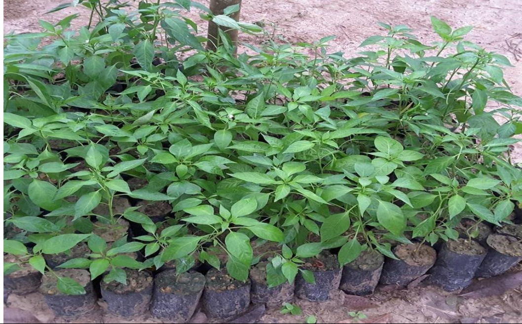
Caption : Antara peralatan memenah yang beliau gunakan.