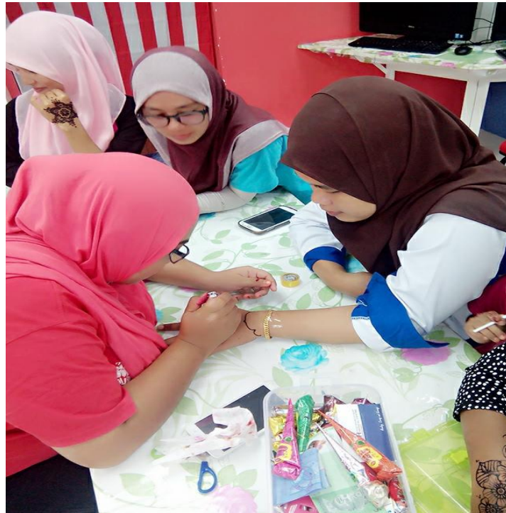
Caption : Peralatan dan penggunaan yang digunakan