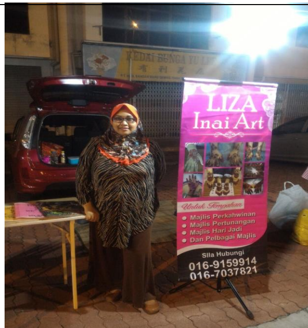
Caption : Gambaran adalah perniagaan offline beliau di Dataran Gemas