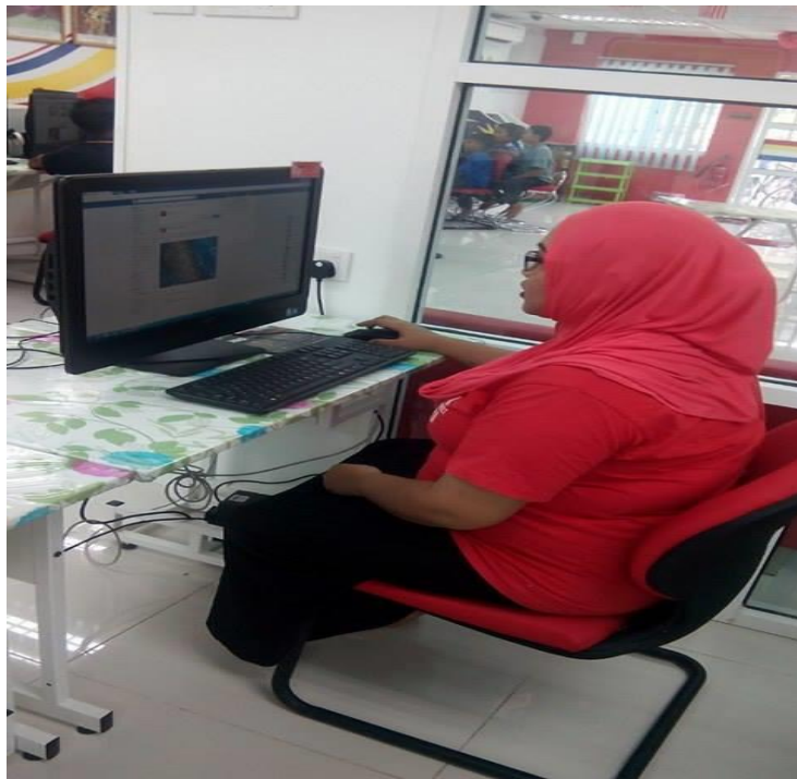
Caption : Peserta Mempelajari cara menguasai Facebook dan kelas Intel