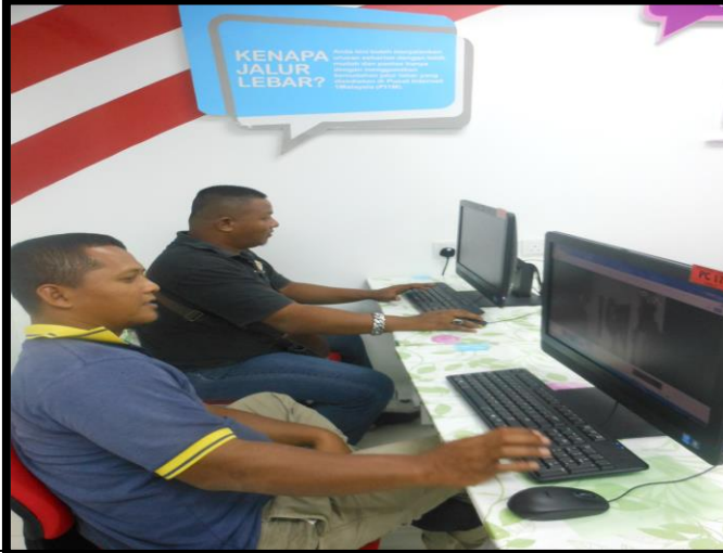
Caption : Peserta sedang belajar teknik menguasai blog