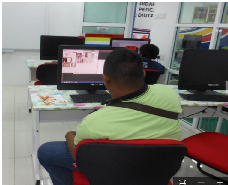
Caption : Peserta sedang belajar teknik menguasai blog