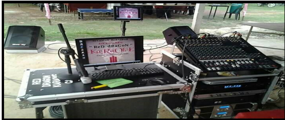
Caption : Peralatan dan penggunaan mainan nada dan bunyi yang sedap didengari.